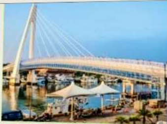
สะพานคู่รักตั้นสุ่ย