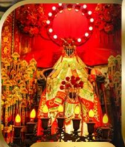
วัดเจ้าแม่กวนอิม ฮ่องซา