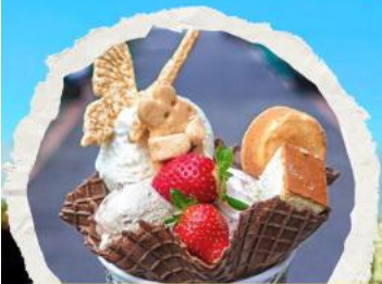
ร้านไอศกรีมมิยาฮาระ