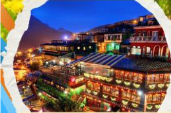
หมู่บ้านโบราณฉิวเฟิง