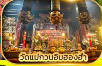
วัดแม่กวนอิมสองฮ่า