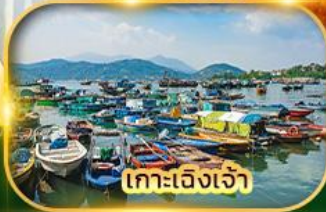
เกาะเจิงเจ้า