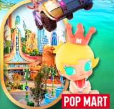
เลือกซื้อทัวร์เสริม เซี่ยงไฮ้ ดิสเนย์แลนด์