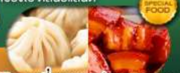
พิเศษ เสี่ยวหลงเป่า หมูแดงพอ เดินทาง ม.ค. - มิ.ย. 69