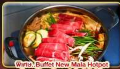
พิเศษ.. Buffet New Mala Hotpot Free Flow Beer & Soft Drink