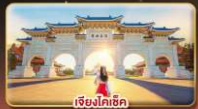
เจียงโคเช็ก