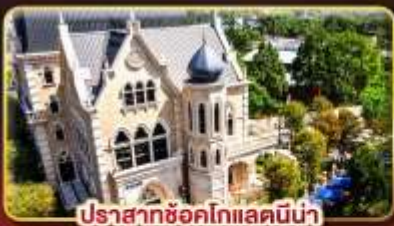
ปราสาทช็อคโกแลตมิน่า

มรดกแห่งเมืองสีกันแห่งไทเป ช้อปปิ้งจุใจ..ตลาดซีเหมินติง ตลาดโตง