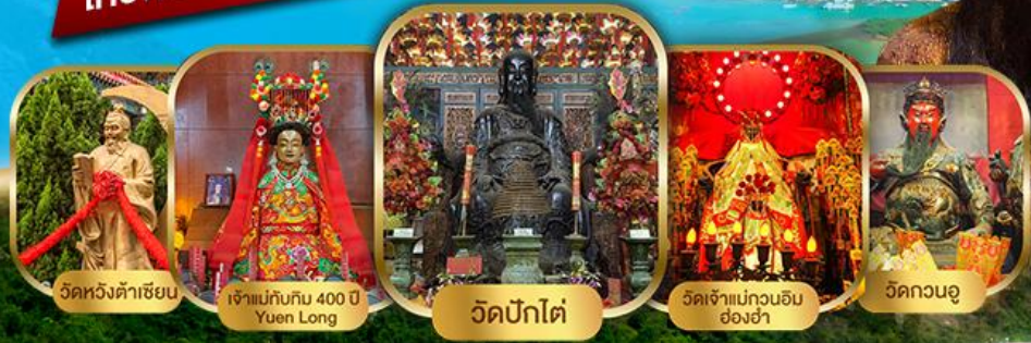
วัดหวังต้าเซียน เจ้าแม่กวนอิม 400 ปี Yuen Long วัดปึกใต้ วัดเจ้าแม่กวนอิม ซ่งฮ่า วัดกวนอู

ไหว้พระ 9 วัด พิเศษ!! อาหารเจ 1 มื้อ เสริมบุญบารมี