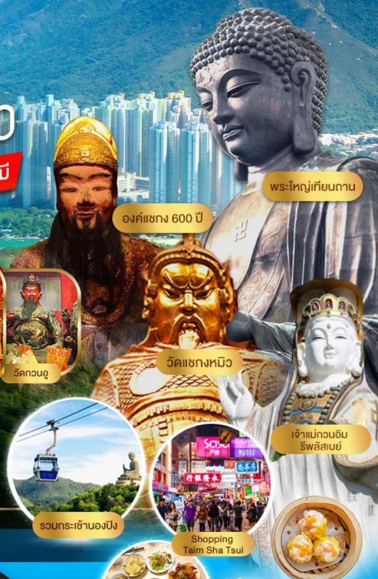
องค์แฉ่ง 600 ปี พระใหญ่เทียนถาน วัดแฉ่งหมิว เจ้าแม่กวนอิม รัชสิสเบย์