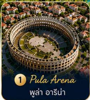
1 Pula Arena ปูลา อาร์น่า