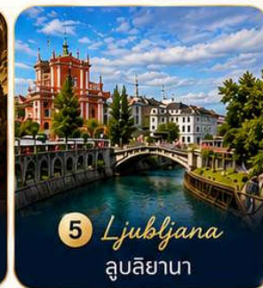
5 Ljubljana ลูบลิยานา