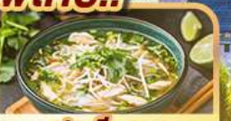
เฟอเวียดนาม