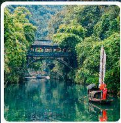
หมู่บ้านชาบเสี่ยหมื่นเจีย