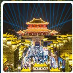
เมืองโบราณเซียงหยาง