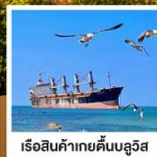
เรือสินค้าเกย์ตันบลูวิส