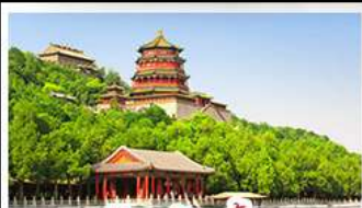
พระราชวังฤดูร้อนอ้าเฮอเฉาหวาน

ท่าแพงเมืองจินด่านจวียกวน - พระราชวังฤดูร้อนอ้าหอยวน สวนจิ่งอัน - วัดลามะ - โมลงร้านช้อป - โรงแรม 4 ดาว มือพิเศษ เปิดปีกกึ่ง สุกีมองโกล MICHELIN GUIDE ร้าน TAO TAO JU