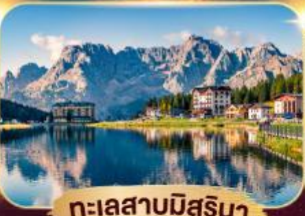
ทะเลสาบมิสูรีนา