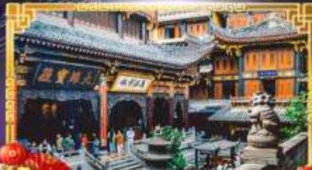
วัดหลิวหวน