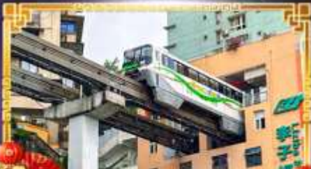
รถไฟฟ้า-ลู่ตัก