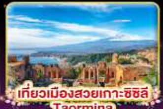
เที่ยวเมืองสวยเกาะซซิลี Taormina