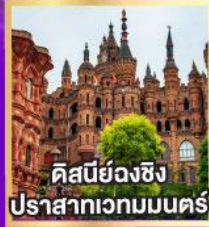
คิสบีย่งฉิ่ง ปราสาทเวทมนตร์