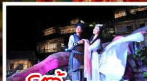
ซีรี่ย์จิ้งจอกขาว