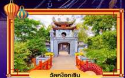
วัดนโงกฮิน