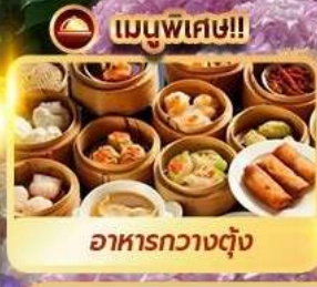
เมนูพิเศษ!! อาหารกวางตุ้ง