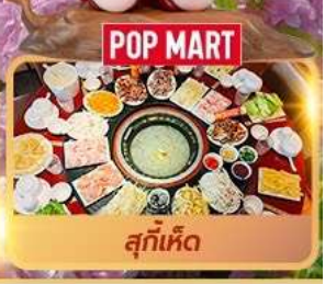
POP MART สุกี้เห็ด