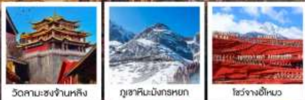
วัดสามะชงจันหลิง