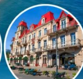
ย่านเมืองเก่าบรรยากาศยุโรป

☁️ การล่องเรือขึ้นอยู่กับสภาพอากาศ กรณีที่ไม่สามารถล่องเรือได้ ทางบริษัทขอสงวนสิทธิ์ปรับเปลี่ยนโปรแกรมตามความเหมาะสม