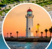
ประภาคารบาตุมิ สัญลักษณ์ของเมือง