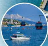
กระเช้าอาร์โก ชมวิวเมืองบาตุมิ