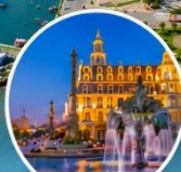
น้ำพุ The Neptun แห่งบาตุมิ