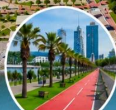
เดินเล่นริมทะเลบรรยากาศสุดชิล