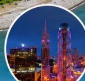
ชมแสงสียามค่ำคืนของเมืองบาตุมิ