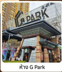
ห้าง G Park