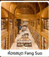
ห้องสมุด Fang Suo