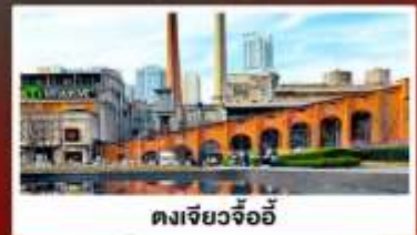
ตงเจียวจ้ออ