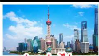
ถ่ายรูปไข่มุก