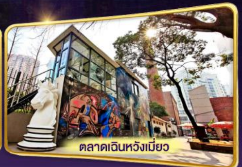
ตลาดเดินหวังเมี่ยว