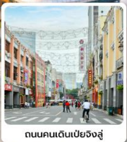
ถนนคนเดินเป่ย์จิงลู่