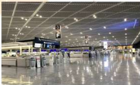
NARITA INTERNATIONAL AIRPORT

“สนามบินนานาชาตินาริตะ” เป็นสถานที่ที่นักท่องเที่ยวส่วนใหญ่จะได้สัมผัสเป็นที่แรกหลังจากมาถึงญี่ปุ่น ที่นี่เป็นสนามบินที่ทันสมัย สะดวกสบาย และได้รับการออกแบบมาเป็นอย่างดี อาคารผู้โดยสารหลักสองแห่งมีทั้งร้านค้า ร้านอาหาร พื้นที่นั่งรอสุดผ่อนคลาย หอชมทิวทัศน์ และกิจกรรมต่างๆ ที่จะให้คุณเพลิดเพลินอยู่ตลอด