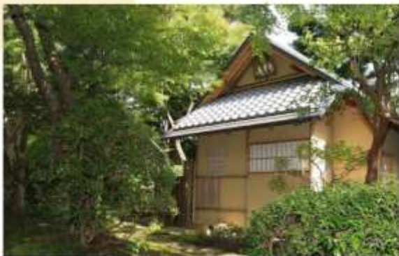
TEA CEREMONY AT SUIKOAN