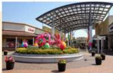
SHOPPING AT SHISUI PREMIUM OUTLETS