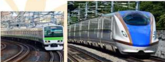
TAKE BULLET TRAIN

เดินทางด้วย "รถไฟชินคันเซ็น" ไปยัง "สถานีรถไฟโอมิยะ" เป็นการเดินทางที่รวดเร็ว สะดวกสบาย และปลอดภัย รถไฟชินคันเซ็นเป็นรถไฟความเร็วสูงของญี่ปุ่น มีความทันสมัยและมีเทคโนโลยีที่ล้ำสมัย ทำให้การเดินทางของคุณเป็นไปอย่างราบรื่นและถึงที่หมายตรงเวลา จากนั้นเปลี่ยนขบวนรถไฟเป็น "รถไฟท้องถิ่น" เพื่อมุ่งหน้าสู่ "สถานีรถไฟชินจูกุ"