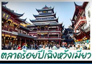
ตลาดร้อยปีเจิ้งหวงเหมียว