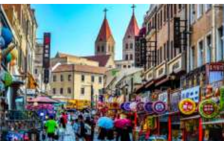
ถนนวงเวียน