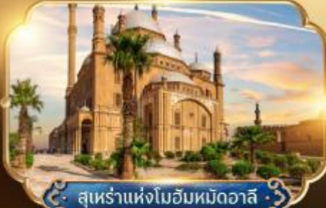
สุเหร่าแห่งโมฮัมหมัดอาลี