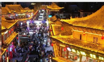
ตลาดกลางคืนจางเย่

*ทางบริษัทฯ ขอสงวนสิทธิ์ในการสลับโปรแกรมทัวร์ตามความเหมาะสมขึ้นอยู่กับสถานการณ์หน้างาน โดยคำนึงถึงผลประโยชน์ของลูกค้าเป็นสำคัญ