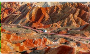
ภูเขาสายรุ้งจางเย่ต้นเสี่ย