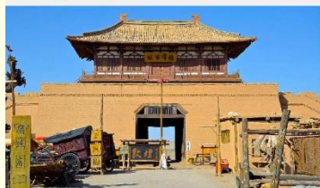
เมืองโบราณตุนหวง