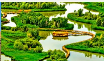
อุทยานพื้นที่ชุ่มน้ำจางเย่