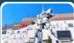
ห้างไดเวอร์ซิตี