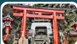
ศาลเจ้าอิโนะชิมะ

เดินทาง 01-05 ก.ค.69 15-19, 18-22 ก.ค.69