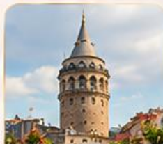
GALATA TOWER หอคอยกาลาตา