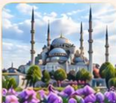
BLUE MOSQUE สุเหร่าสีน้ำเงิน