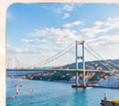
BOSPHORUS STRAIT ช่องแคบบอสฟอรัส