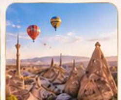
CAPPADOCIA คัปปาโดเกีย