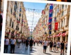
ISTIKLAL STREET (Grand Avenue of Pera) ถนนสายช้อปปิ้ง ยิม ฮีล ครองใจในใจเดียว