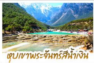
เขื่อนเขาพระจันทร์สีน้ำเงิน