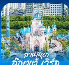
สวนสนุก ล็อตเวิลด์