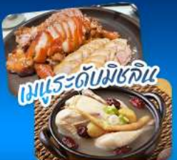
เมนูระดับมิชลิน

เที่ยวชม 3 เมืองฮิต โซล - แทกู - ปูซาน สัมผัสเสน่ห์เกาหลีหลากหลายสไตล์ • ชมพระราชมังคลาภิเษกมณฑล ดึก Lotte World Tower พร้อมจุดชมวิว Seoul Sky ในกรุงโซล • ช้อปปิ้งถนน Art Street คาบอຍ BTS ตลาดชอมน • แลนด์มาร์ก 83 Tower ที่แทกู • ปักท้ายที่ปูซานกับวัดแสงดงยงกซา หมู่บ้านวัฒนธรรมคิมซอน ไฮไลต์นั่งรถไฟสายแคบปูซานวีกะเลสสุดประทับใจ • เดินทางสะดวกด้วยรถไฟความเร็วสูง KTX อิ่มอร่อยกับเมนูพิเศษ จากเกาหลีและได้ดื่มสมรสดับมิชลิน เก็บครบทุกความประทับใจในทริปเดียว