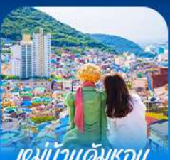
หมู่บ้านดัมซอน