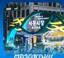
ตลาดชอมน