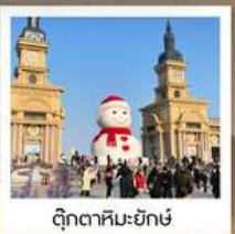
ตึกตาคิยะยักซ์