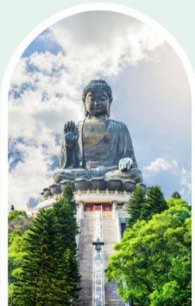
พระใหญ่โป่หลิน