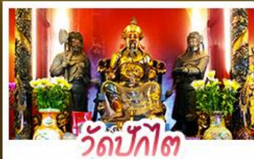
วัดปักไต้