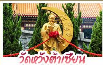
วัดเข่งต้าเซียน