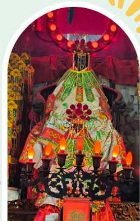
วัดเจ้าแม่กวนอิมของอ่ำ