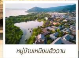
หมู่บ้านเหนียนฮิววาน

🗋️ โหลด 23 KG. x1 ทั้งไป - กลับ ✓ พรีเมียมทิวส์ ✓ ไม่เข้าร้านรัฐบาล ✓ ทิวส์กรุ๊ปเล็ก ✓ รวมค่าเข้าสถานที่ตามโปรแกรม