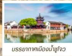
บรรยากาศเมืองน้ำซูโจว