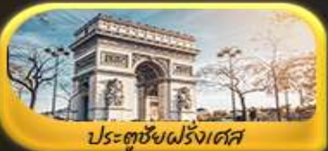
ประตูชัยฝรั่งเศส

พิเศษ!! ล่องเรือแม่น้ำแซนชมเมือง โดย บาโด มูช