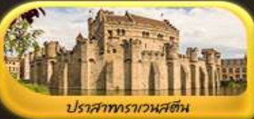
ปราสาทราเวนสตีน