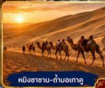
หมิงซาซาน-กำแพงเกาคุ