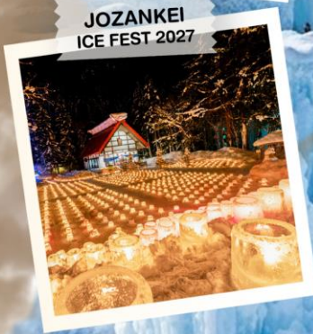
JOZANKEI ICE FEST 2027