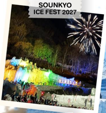
SOUNKYO ICE FEST 2027