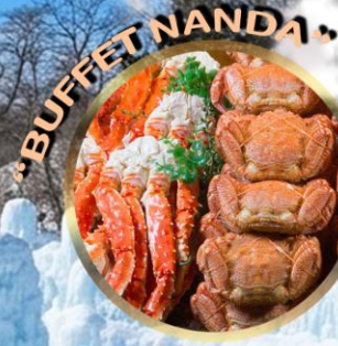
LAKE SHIKOTSU ICE FESTIVAL 2027