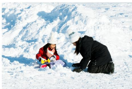
Playing in the snow