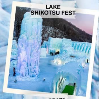
LAKE SHIKOTSU FEST