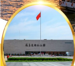
พิพิธภัณฑ์สงคราม เกาหลีตานตง