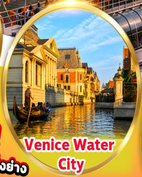
Venice Water City