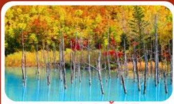
บลูพอนด์ (บ่อน้ำสีฟ้า)