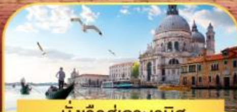
นั่งเรือสุทเทะเวนิส