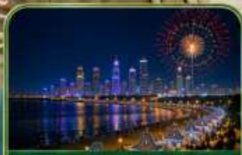
NO 3 Bathing Beach ชมไฟกลางคืน