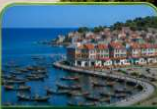
หมู่บ้านประมงซาจื่อไ่