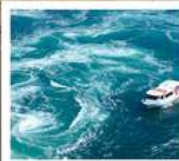
ค่องเรือชมน้ำวนมารุโตะ

วัดบึงไชน / ตลาดกิงงะ / โบสถ์โทกาวาน (จุดชมวิว) / สะพานคินไตเคียว เกาะมียาจิมา ศาลเจ้าอิตสึคุชิมะ / สวนอนุสรณ์สันติภาพฮิโรชิมา โตโกะออนเซ็น / ถนนโอโมเตะซันโด คมปิระซัง / ปราสาทมัตสึยามา กิจกรรมทำเส้นอุด้ง / สวนริทสึริน / สถานีรับทางคุรุคุรุมารุโตะ ค่องเรือชมน้ำวนมารุโตะ / ซุปบึงย่านชินโซบาช / ตลาดปลาคุโรเมง / ซุปบึงย่านอุมาเดะ