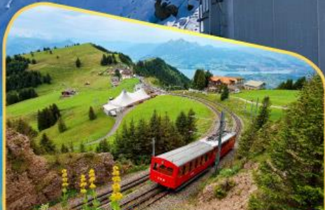
นั่งรถไฟขึ้นสู่ยอดเขาโรติก