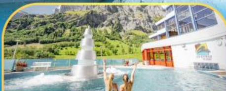
แช่น้ำแร่ร้อนผ่อนคลายลวยคอร์บิค