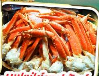
บุฟเฟ่ต์ขาปูยักษ์