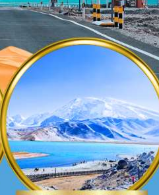
Kala Kule Lake