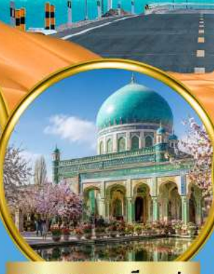
สุสานสมหอมเซียนเฟย